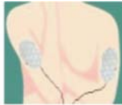
Figur 3 Arme