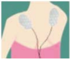
Figur 6 Nakke og skuldre