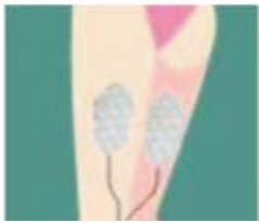
Figur 5 Lår