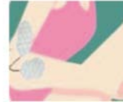
Figur 8 Forarm