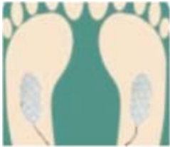
Figur 1 Fødder