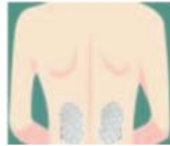
Figur 7 Nedre ryg