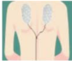
Figur 2 Øvre ryg